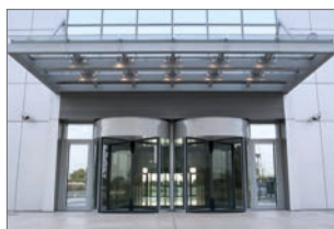
Hotele i miejsca organizacji imprez